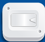
1 INTERRUPTOR COMBINACIÓN