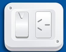
1 INTERRUPTOR 1 TOMACORRIENTE